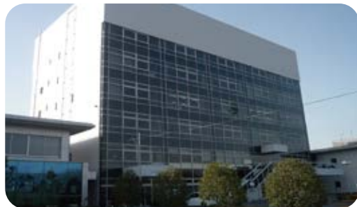
一般社団法人岐阜県自動車会議所 (本部事務所)

当会議所は、設立当初より自動車の検査・登録や自動車諸税に関わる行政機関補助業務のほか、交通事故防止や交通遺児への激励、自動車に関する環境活動など、健全なクルマ社会の発展に努めています。